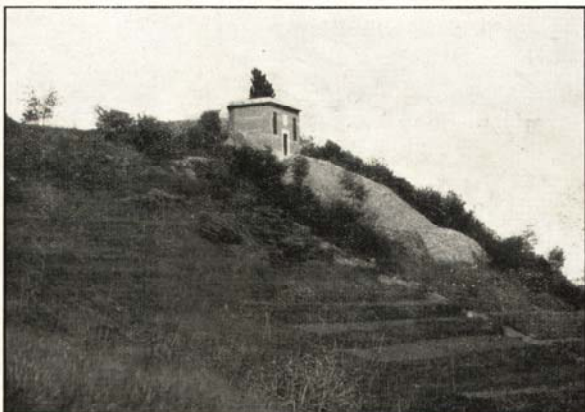
Fig. 10 - Serbatoio di M. Robbio (500 mc.) Cabina di accesso.

che invece che nello spazio corre nel tempo.