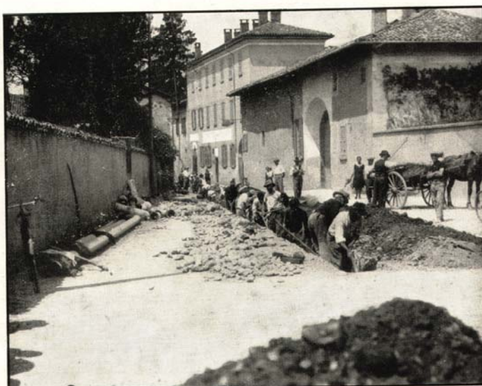
Fig. 9 - Posa condotte in Robbiate

Abbiamo case sempre più grandi e confortevoli, ma continuiamo a costruirne di nuove. Molte case sono vuote, molti hanno la seconda casa ed alcuni anche la terza: case al mare, case in campagna, case in montagna, case in collina. Un po' di tempo fa a 18 anni era subito indispensabile l'automobile, adesso occorre la casa per viverci da soli; statisticamente siamo vicini ad un'automobile a testa, tra un po' arriviamo ad una casa a testa.